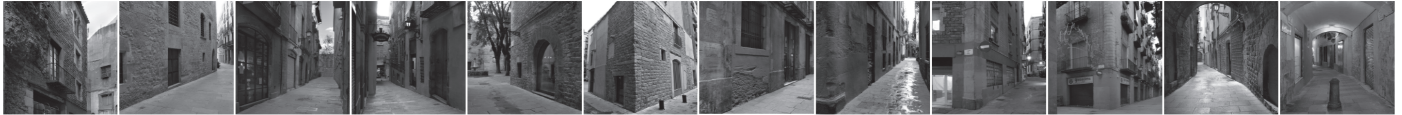
1 Carrer del Call Era el carrer que anava al barri jueu

I, finalment, recordem Montjuïc, la «muntanya dels jueus», on hi havia hagut el seu cementiri i, a més, terrenys i cases: un ampli espai amb grans vistes a la muntanya, el mar i la ciutat que els permetia esbargir-se i oblidar l'estretor del Call.