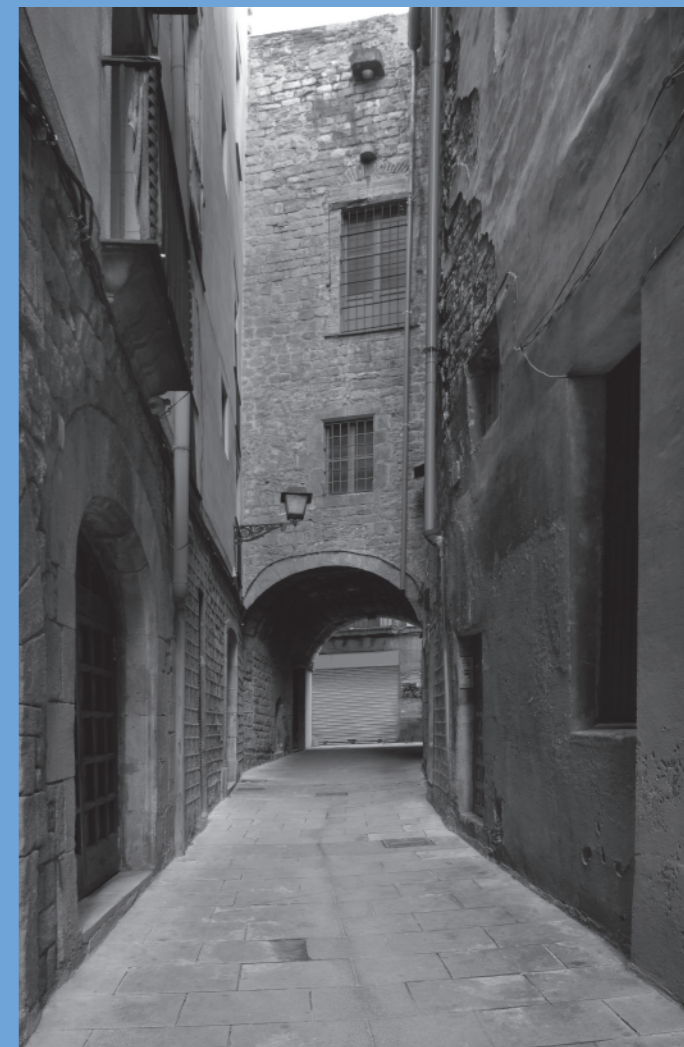
La torre de la Volta del Remei, al Call Menor

PUNTS D'INTERÈS HISTÒRIC: EL CALL DE BARCELONA [C]